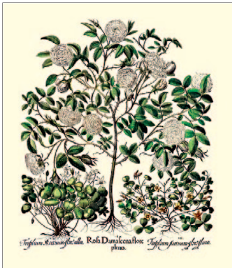
Rosa x damascena flore pleno . Da Basilius Besler, Hortus Eystettensis , Norimberga 1613

la celebre Rosa di Damasco, Rosa x damascena . In realtà questa importazione non è data per certa da vari studiosi.