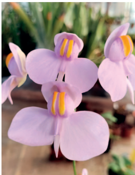
Nymphaea 'Fire in the Sky' Vivaio WaterNursery