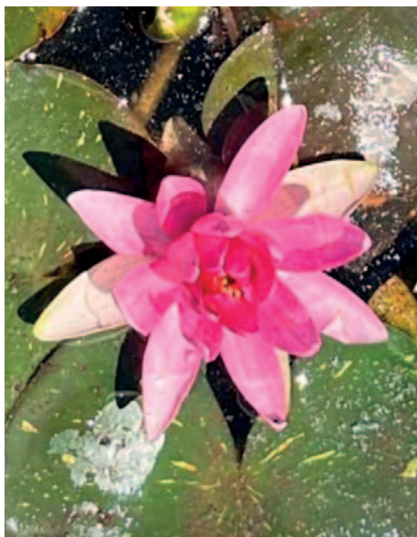
Utricularia reniformis 'Flowering clone' Vivaio Un Angolo di Deserto