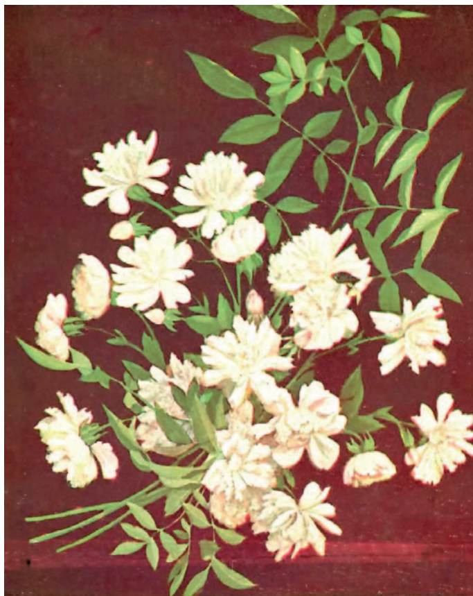
Rosa sarmentosa N. 123

divulgazione. Quest'ultimo aspetto veniva perseguito anche con una intensa attività editoriale esercitata su riviste specialistiche e no, quali «L'Agricoltura Ligure», «La Costa Azzurra Agricolo Floreale», «Il Giardino Fiorito».