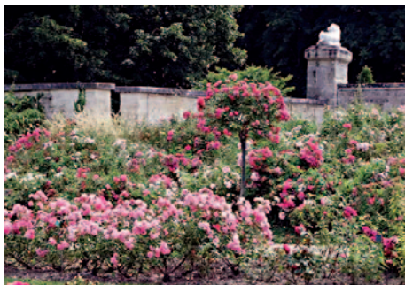
L'attuale roseto del Castello de Malmaison

All'epoca le rose donavano ai loro appassionati gioie grandi ma effimere, troppo brevi per appagarli; era necessario trovare un rimedio che arrivò dalle specie cinesi dotate del 'superpotere' della rifiorenza e gli ibridatori si misero lesti al lavoro ottenendo incroci che vediamo ancora nei nostri giardini. Nacquero le rose tea, caratterizzate da profumo delicato e petali appuntiti; si svilupparono gli ibridi di tè e le rose moderne, le più diffuse e, infine, nel XX secolo la genetica e la selezione assistita hanno ottenuto varietà più resistenti a malattie, con colori nuovi e una maggiore durata post-raccolta.