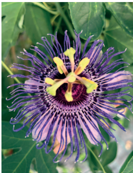
Passiflora 'Arenella' Azienda Agricola D'Aleo